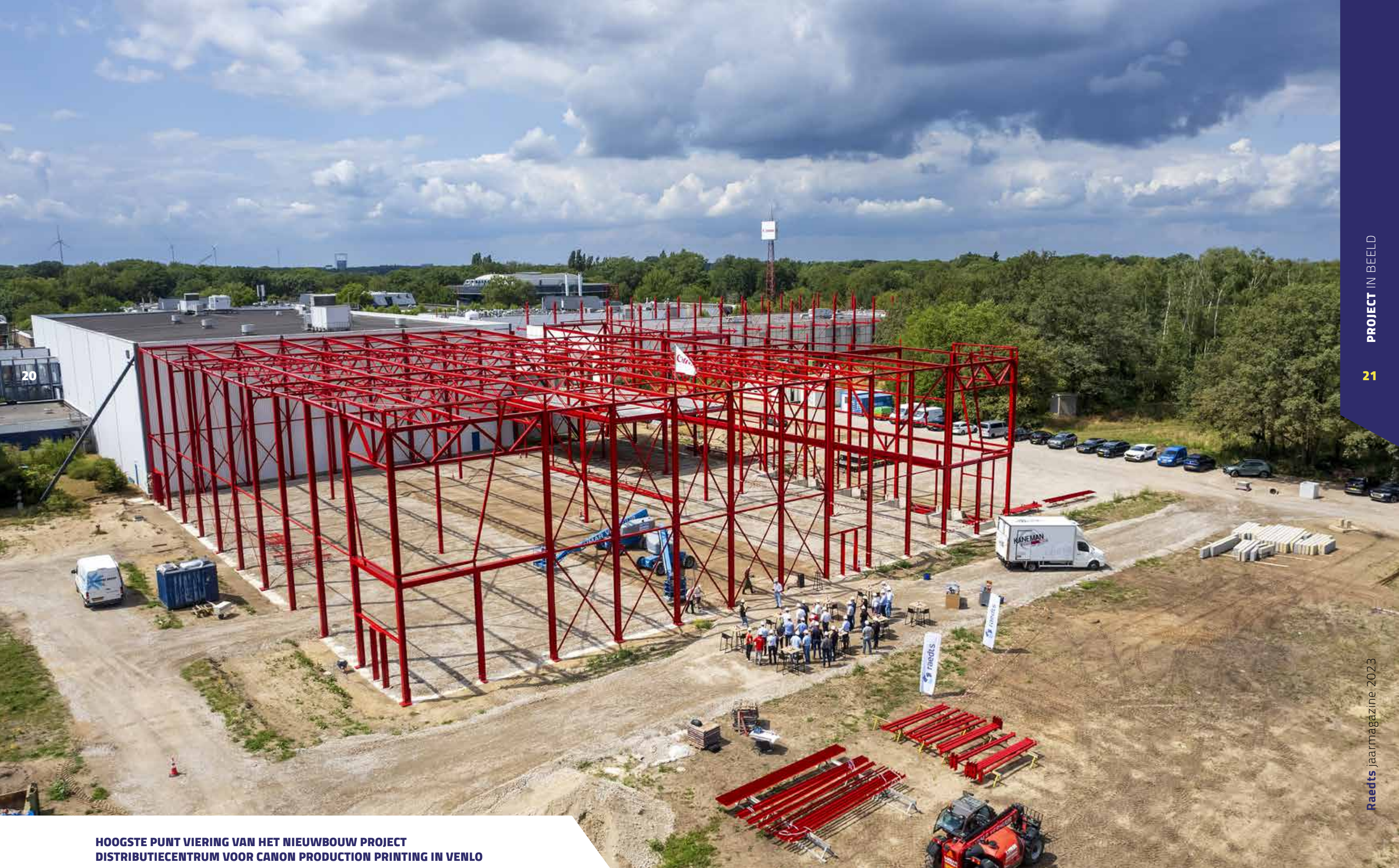
HOOGSTE PUNT VIERING VAN HET NIEUWBOUW PROJECT DISTRIBUTIECENTRUM VOOR CANON PRODUCTION PRINTING IN VENLO